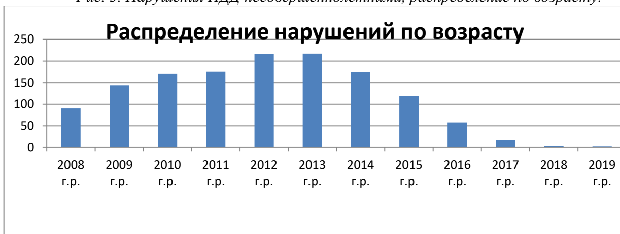
Рис. 3. Нарушения ПДД несовершеннолетними, распределение по возрасту.

Сделав выборку по образовательным учреждениям, было выявлено, что учащиеся следующих красноярских учебных заведений, а именно: