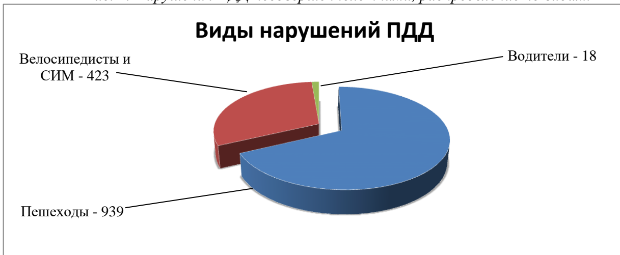
Рис. 2. Нарушения ПДД несовершеннолетними, распределение по видам.

Анализируя возрастные характеристики несовершеннолетних, нарушивших ПДД, можно сделать вывод, что к группе риска относятся дети 10-13 лет, которые характеризуются стойкими проявлениями «переходного возраста», психофизиологическими изменениями личности и импульсивностью поведения (рис. 3).